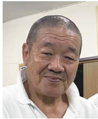
プロレスラー 藤原喜明

1973年 京都府立医科大学卒業 第一外科入局 1977年 秋田大学医学部外科 1982年 米国テキサス大学 ヒューストン校留学 1995年 京都府立医科大学 第一外科助教授 2000年 癌研究会附属病院 消化器外科 2015年 がん研究会有明病院 病院長 2018年 がん研究会有明病院 名誉院長 専門は消化器癌、特に胃癌